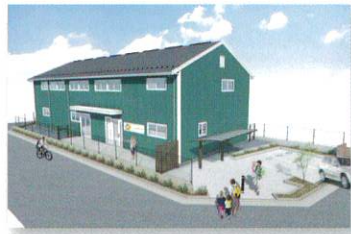
園舎完成イメージ